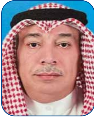
إعداد الدكتور / سالم محمد معطش العنزي